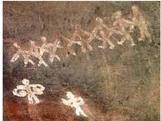
Bild einer Tanzformation aus den Höhlen von Bhimbetka

Der Tanz ist so alt wie die Menschheit selbst. Schon immer wurde getanzt, zu mindestens belegen dies die Aussage und Auswertungen verschiedener historische Belege. Angefangen bei der Höhlenmalerei, die man in den Höhlen Bhimbetka 4 fand, oder andere Fundstücke. Im heutigen Zeitalter