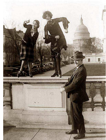
Charleston Dancing at the Capitol

Nach Ende des Krieges 1945 begann mit dem Wiederaufbau von Strukturen und Städten auch eine neue Entwicklung des Tanzes. Swing nannte sich nun Jive und parallel dazu entstand der