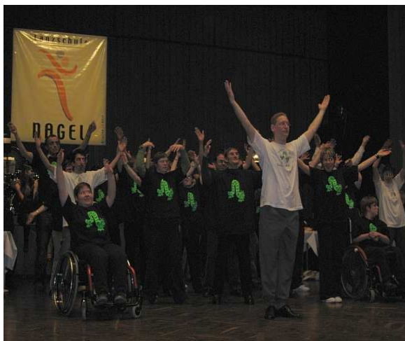
Auftritt im Pfalzbau Ludwigshafen Ball der Tanzschule Nagel, Dez. 2006

Es ist ein "Ausbruch" aus der Isolation von der restlichen Gesellschaft in ein „Abenteuer“, kurzum ins Ungewohnte. Jeder von ihnen gewinnt neue Eindrücke und macht individuelle Erfahrungen.