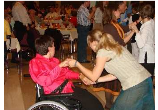
Szene vom 10jährigen Jubiläumsball des Tausendfüssler-Club 2006

Die damaligen Befürchtungen, nicht genug Interessenten für ein solches Angebot für behinderte Menschen zu finden, verflüchtigte sich schnell. Wegen der großen Nachfrage wurden aus dem zu Anfang gedachten einen Kurs gleich zwei Kurse für geistig- und mehrfach behinderte Menschen. Seit der offiziellen Gründung des Vereins am 07.12.1996 nahm er immer mehr an Größe zu. Im Februar 1997 zählten