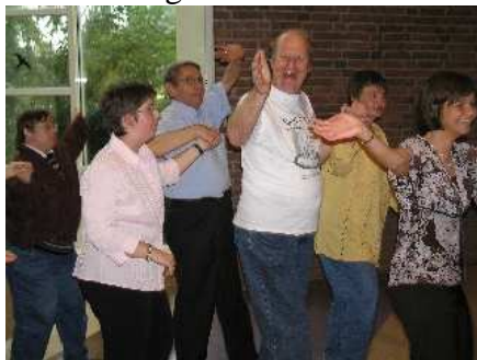
Szene vom 10jährigen Jubiläumsball des Tausendfüssler-Club 2006

sich 67 Mitglieder zu den Tausendfüsslern, von denen 60 aktiv am Tanzen teilnahmen. Heute sind es schon über 300 Mitglieder. Der Verein organisiert sich selbst durch ehrenamtliche Mitarbeiter und Eltern, die dabei helfen Tanzgruppen zu leiten und auch Ausflüge (Faschingsumzug und Konzerte) zu begleiten.